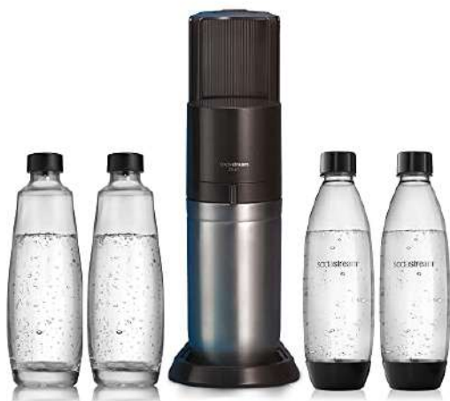
Sodastream Duo Megapack, Gasatore D'Acqua Per Trasformare L'Acqua In A...